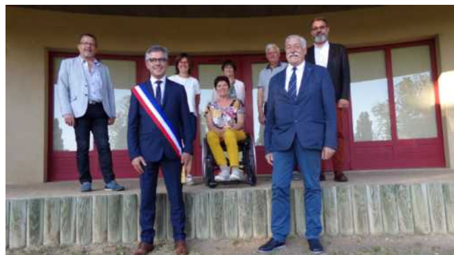
Monsieur Le Maire et ses Adjoints