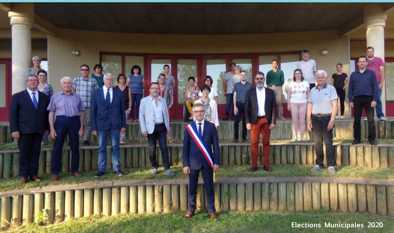
Elections Municipales 2020